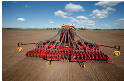
Semoir Spirit 600S