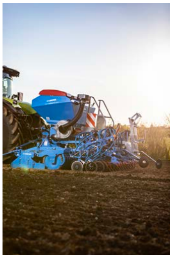
Solitaire 9+ Duo