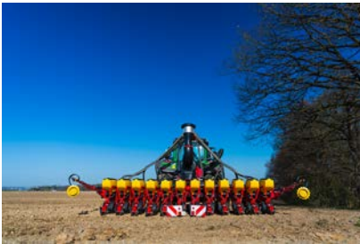
Semoir monograine Tempo V12

Précision, polyvalence et débit de chantier, la nouvelle référence sur le marché.