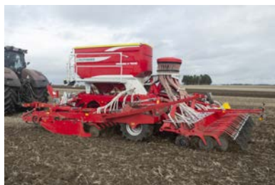
Pottinger Terrasem C4