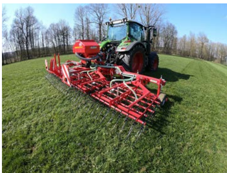
Herse étrille de prairie PNEUMATICSTAR PRO 600

Largeur de travail de 6 m équipée d'un semoir pneumatique PBOX STI qui peut être installé sur toutes les machines pour permettre le semis à la volée.