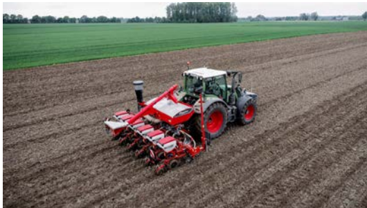
Semoir Optima V SX

Le semoir ts-drill Kverneland est capable d'affiner le lit de semences et de déposer la graine avec précision grâce à la vibration de sa dent au travail. Il bénéficie d'une trémie grande capacité de 1700 litres. Le ts-drill nécessite une faible puissance de traction malgré sa largeur de travail pouvant atteindre jusqu'à 6 m.