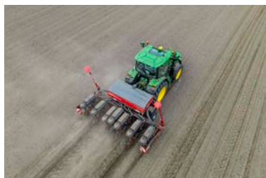
Maestro 7 TX

Le Maestro TX est le nouveau modèle de semoir monograine pour des largeurs de travail de 2,60 m à 4,80 m. Le semoir est équipé de série d'un châssis télescopique à écartement variable. Il est ainsi possible de régler des écartements entre rangs variables de 37,5 cm à 80 cm. Le Maestro TX peut être équipé en option d'une grande trémie de 1300 l dédiée à la fertilisation. L'engrais est localisé à proximité du rang par l'intermédiaire des socs fertilisateurs monodisques alimentés par deux doseurs HORSCH éprouvés. Le semoir est équipé de série de la coupe demi-semoir pour l'engrais. Le Maestro TX est équipé du système bien connu de doseur AirSpeed, qui fonctionne par surpression. Cette technologie permet de semer à des vitesses pouvant atteindre 15 km/h, tout en garantissant la plus grande précision dans le placement de la graine et une mise en terre optimale.