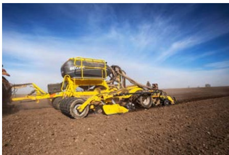
Semoir Bednar Omega 006000L

Le système de dosage est capable de doser les semences de manière très précise et ce, dans une plage comprise entre 0,6 et 350 kg/ha.