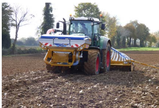
Combiné de semis avec trémie frontale pour semis

En plus de son design séduisant, les aspects pratiques ont été soignés avec caisse à outils intégrée, lumière de courtoisie pour les pesées de nuit ou encore les bavettes de protection pour éviter le salissement sur route.