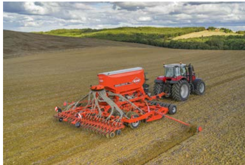
Semoir ESPRO 6000 RC