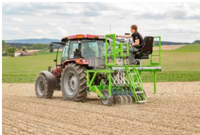
Semoir de parcelle PlotMotion

Semoir de parcelle PlotMotion à distribution électrique. Ce semoir permet d'implanter des parcelles d'essais avec une grande précision grâce au déclenchement assisté par GPS tout en respectant une stricte répartition sur toute la longueur de la parcelle.